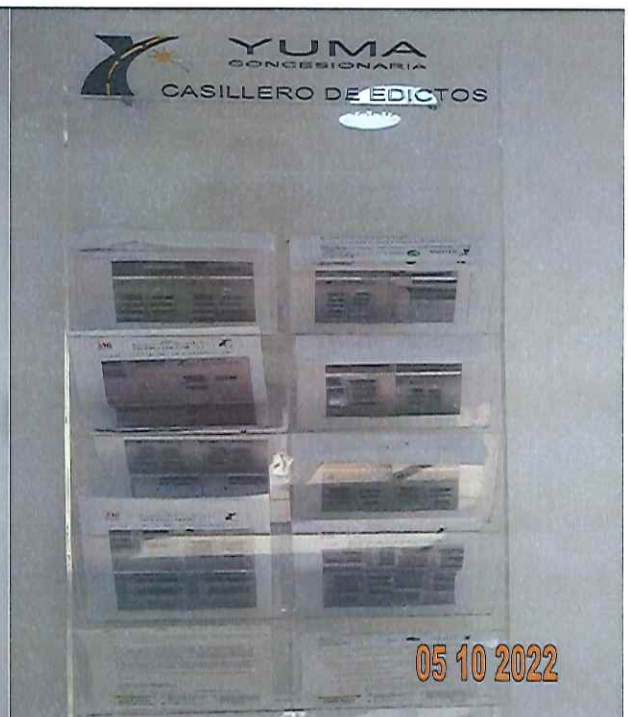
EDICTOS DE LA R_35371 YC-CRT-119556